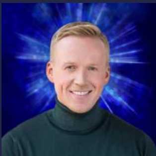
Papst Thomas Allaut